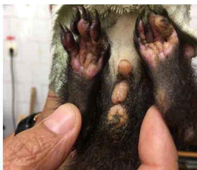
Fig. 1. Clinical aspects – edema, exudation and crusting of the pads, penial, scrotal and anal area

The squirrel youngsters were fed with cat milk substitutes for the following five weeks after being recovered. Crusty nodules appeared on the lids, ears and on the dorsal sacral region, disseminating on the entire body over another week. Edema of the ears, pads, anus and genitals was seen shortly after, accompanied by exudation and hair loss in the lesional sites (Fig. 1, 2, 3)...(Text - Arial 10, aliniere stânga-dreapta (justified), paragraf 0,5" (1,25 cm), urmat de un spațiu de 10 p)